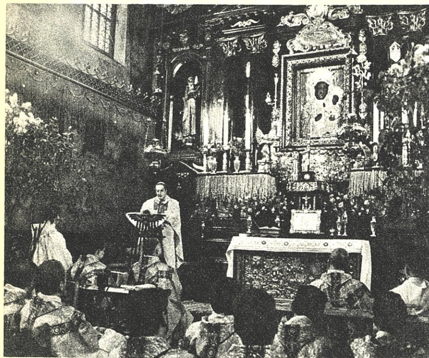
La concelebrazione nel Santuario di Jasna Gòra.

Il 22 aprile ha avuto luogo la visita del Card. Martini alla Chiesa di Polonia dietro invito del Card. Glomp. La Chiesa polacca festeggiava il millesimo anniversario della consacrazione episcopale del suo patrono S. Adalberto. Un incontro significativo, se collocato nel difficile momento storico che la Polonia sta attraversando.